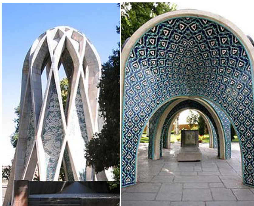
آرامگاه کمال الملک در راست و حکیم عمر خیام در چپ

شهر نیشابور یکی از شهرهای استان خراسان رضوی در شمال شرق ایران می باشد. شهرستان نیشابور از شمال با شهرستان قوچان، از شرق با چناران و مشهد، از جنوب با تربت حیدریه و کاشمر، از غرب با سبزوار مرتبط است و در مسیر جاده ابریشم و مسیر ترانزیتی تهران-مشهد-افغانستان واقع می باشد. جلگه نیشابور از شمال و شرق به بلندترین ارتفاعات استان یعنی ارتفاعات معروف بینالود از جنوب به ارتفاعات کوه سرخ کاشمر و چهل تن تربت حیدریه و از غرب به کویر سبزوار ختم می شود و از حاصلخیزی بسیار بالایی برخوردار است.