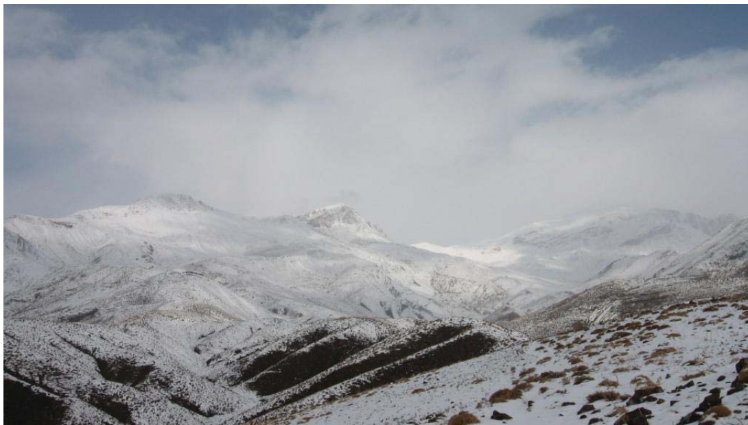
قله بینالود و زرگران

ساعت ۴:۳۰ از قله شروع به سرازیر شدن به سمت گردنه کردیم. در میانه مسیر وجود برف در زمین توسط بچه‌ها احساس شد که باعث شد یه تیکه از مسیر رو به سرعت و بدون استفاده از باتوم‌ها پایین بیاییم. حدود ساعت ۵:۳۰ دیگه تقریباً هوا هم تاریک شده بود. در نهایت با سلامت ساعت ۶:۴۵ دقیقه به جانپناه رسیدیم و شب رو توی جانپناه یه استراحت گرم و عالی کردیم.