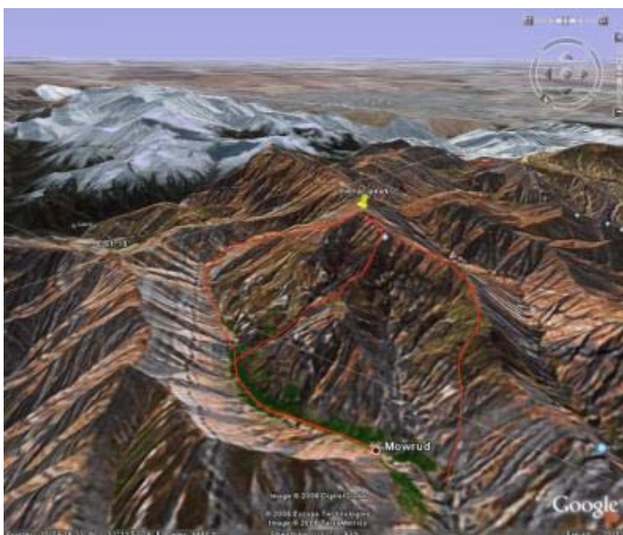
دامنه صعود به قله از روستای مورود

در شرق روستای مورود در شمال قله منار، دره زیبایی قرار دارد که توصیه می‌شود برای صعود از این دره بگذرید تا زیبایی‌های آن را از دست ندهید.