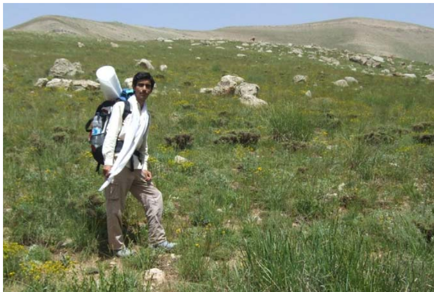
مراتع چمن مخمل

مراتع چمن مخمل پر از سبزه‌ها و گیاهان معطر نظیر پونه و گلای رنگارنگه که زیبایی فوق‌العاده‌ای به این مراتع داده ولی از درخت خبری نیست!