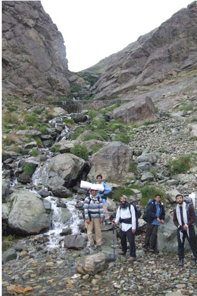
مسیر شیرپلا به ایستگاه ۵ - دره اوسون

طبق معمول همیشه، خوراکی های برنامه خیلی زیاد بود. برا همین هم پولش زیاد شد و هم اینکه خیلی بارمون سنگین بود. فراغ بال توی این برنامه باعث شد یه تصمیم دیگه هم بگیریم: کم کردن خوراکی ها تو برنامه- هامون، از نظر حجمی و قیمتی!