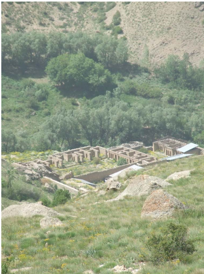
کاخ ناصرالدین شاه

از حدود ۳۰ دقیقه مانده با کاخ ناصرالدین شاه چشمه‌های زیادی پیداشون می‌شه و دره پر از درخت می‌شه و از خود کاخ تا روستا، پر از باغ با درخت‌های آلبالو و گیلاس است.