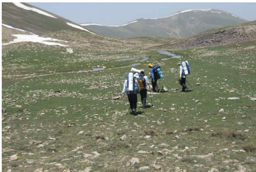
قبل از سرازیر شدن

دامنه توچال، از سربند تا پناه‌گاه شیرپلا دارای رودخانه می‌باشد. همچنین دره اوسون نیز رودخانه دارد. ولی مسیر تله‌کابین کاملاً خشک است. از شیرپلا به بعد نیز آب نمی‌باشد مگر در کنار پناه‌گاه امیری که چشمه کم-آبی وجود دارد که خیلی نمی‌شه بهش اعتماد کرد. در سمت شرق پناه‌گاه امیری نیز با حدود ۳۰ دقیقه پیاده-روی می‌توان به آب رسید، ولی آب مناسبی نمی‌باشد. بر روی خط‌الراس توچال، قبل از سرازیر شدن به دره شهرستانک آب حاصل از ذوب برف‌ها وجود دارد.